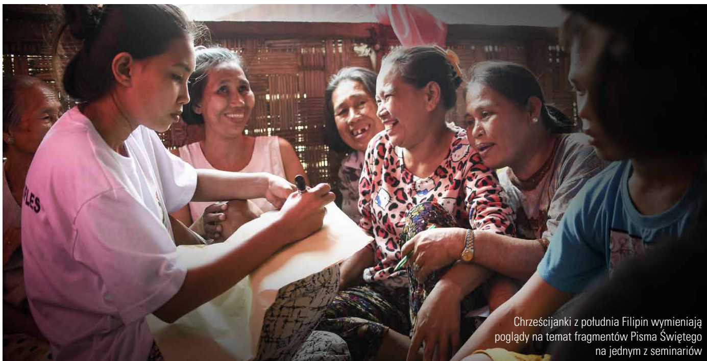
Chrześcijanki z południa Filipin wymieniają poglądy na temat fragmentów Pisma Świętego na jednym z seminariów