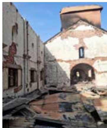
Kościół zniszczony w wyniku ataku bombowego

ERYTREA: Erytrejscy chrześcijanie trafiają do więzienia za wiarę i tam, w okrutnych warunkach, są przetrzymywani latami. Na początku grudnia 2024 r. władze ponownie aresztowały 13 chrześcijan. Módlmy się o ich szybkie uwolnienie i pomoc Jezusa podczas pobytu w więzieniu. /