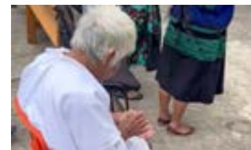
Jeden z chrześcijańskich uchodźców

MEKSYK: W stanie Chiapas chrześcijanie z trzech wspólnot protestanckich uciekli do innej wioski, ponieważ nieustannie otrzymywali pogróżki ze strony zorganizowanych grup przestępczych. Obecnie 108 chrześcijan, w tym dzieci i osoby starsze, śpią w trudnych warunkach w jednej z hal w wiosce. Módlmy się o Boże zaopatrzenie i prowadzenie. /